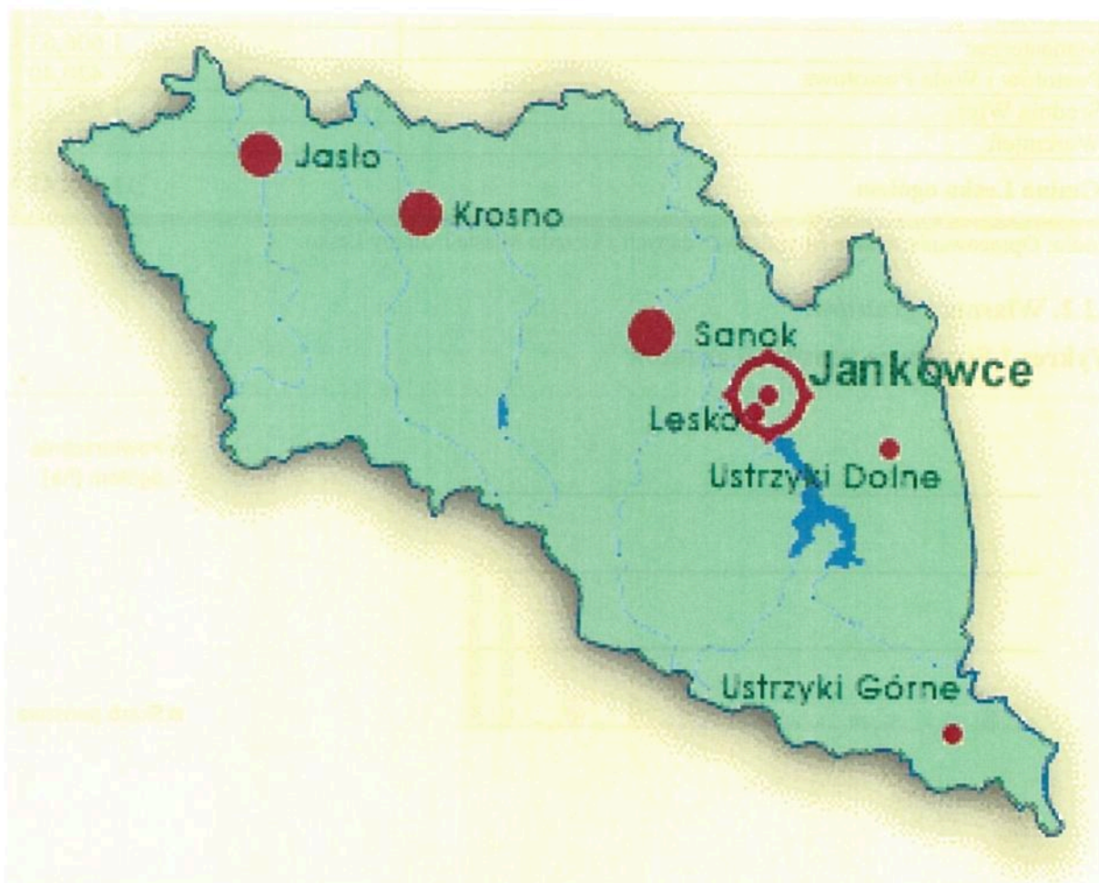
Mapa 1 Lokalizacja miejscowości Jankowce.